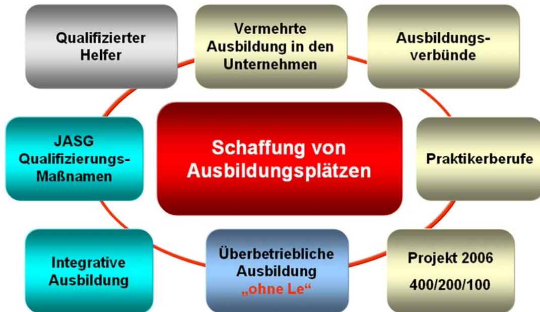
Abbildung 2 zeigt die unterschiedlichen Projekte, die zusätzliche Ausbildungsplätze schafft.

Wir müssen die große Herausforderung annehmen und zeigen, dass diese Regierung in Zusammenarbeit mit den Sozialpartnern in der Lage ist, das fast Unmögliche wahr zu machen, allen ausbildungsfähigen Jugendlichen einen Ausbildungsplatz anzubieten.