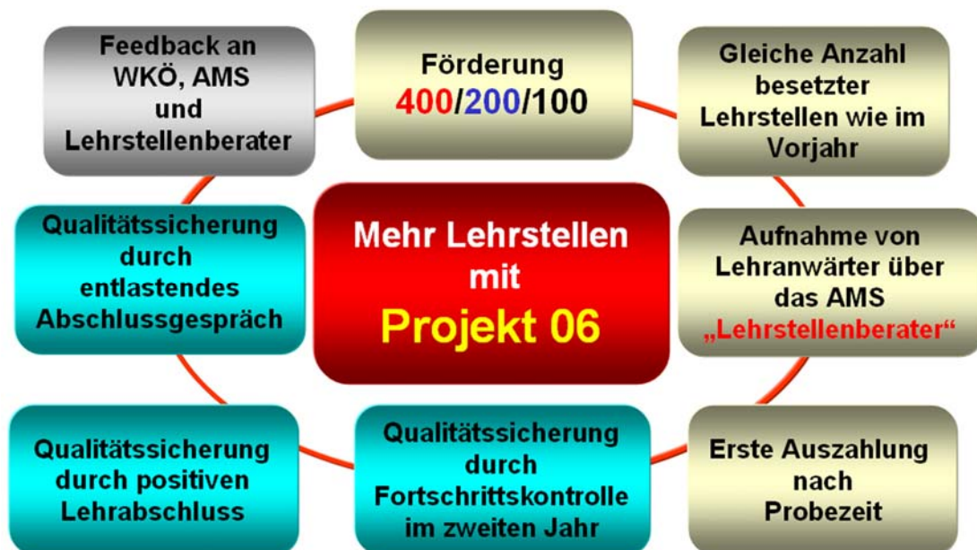
Abbildung 4 zeigt die Bedingungen für eine Ausbildungsförderung auf.

Das Projekt 06, das aus heutiger Sicht für eine Übergangszeit von zwei bis vier Jahren eingesetzt werden muss, sieht vor, dass mit dem Betrag eines für acht bis zwölf Monate angesetzten JASG Lehrganges eine dreijährige Lehre absolviert werden kann.